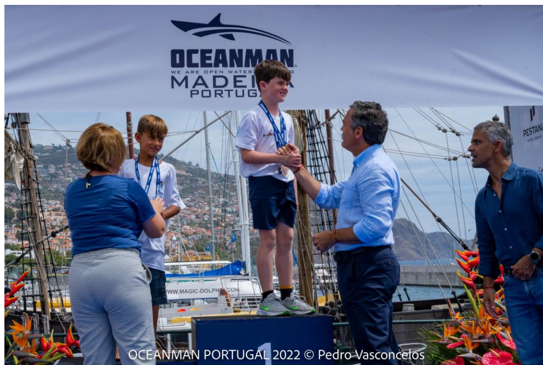
OCEANMAN PORTUGAL 2022

A CATEGORIA DO PARTICIPANTE É CALCULADA SEGUNDO A DATA EXATA DO TORNEIO. OU SEJA, PARTICIPANTES COM O MESMO ANO DE NASCIMENTO PODERÃO NÃO PERTENCER À MESMA CATEGORIA. – CRITÉRIO OCEANMAN