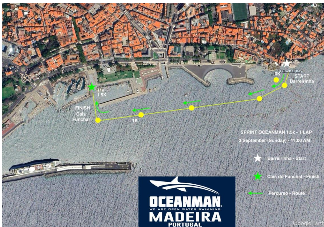
Imagem 5. Croqui – 1,5K SPRINT

Associação de Natação da Madeira Instituição de Utilidade Pública – Resolução n.º 424/2012, de 12 de Junho de 2012