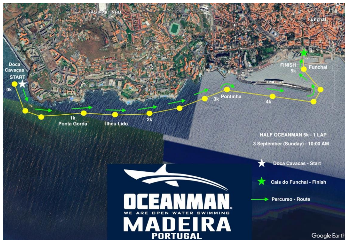
Imagem 3. Croqui – 5K HALF OCEANMAN

Associação de Natação da Madeira Instituição de Utilidade Pública – Resolução n.º 424/2012, de 12 de Junho de 2012