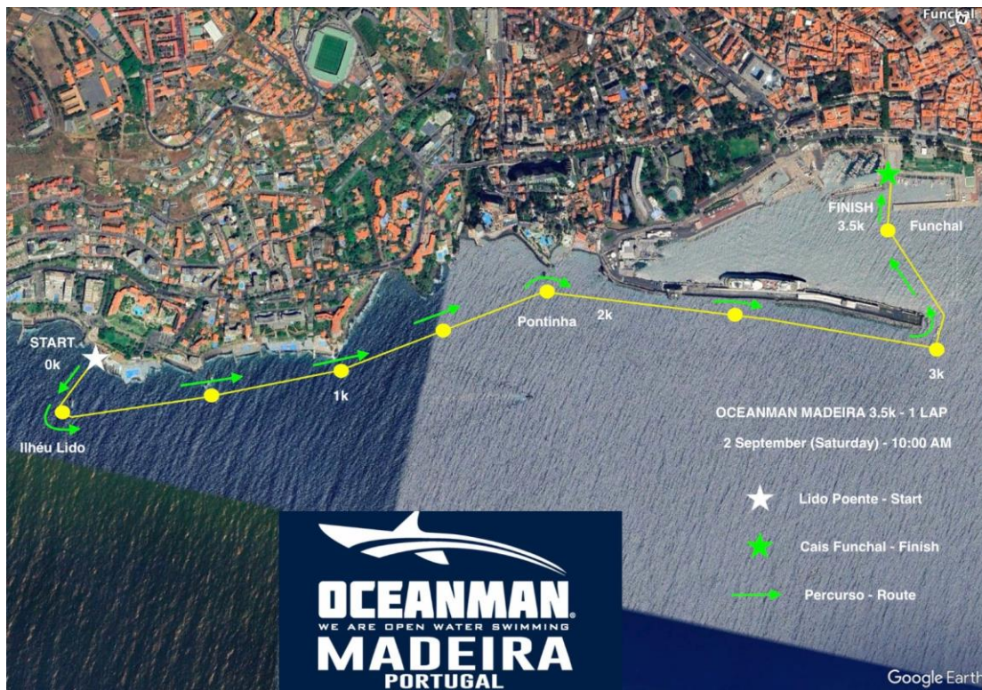
Imagem 4. Croqui – 3,5K OCEANMAN MADEIRA