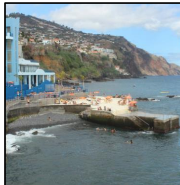
2. Meta praia Complexo Balnear da Barreirinha